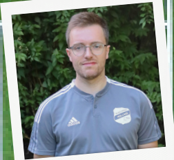
SL · D. LUTZER