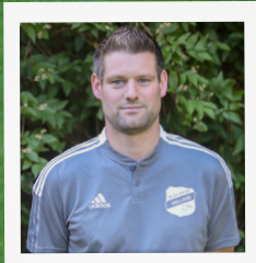
TWT · T. LANWERT