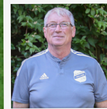
TM · G. BALLMANN